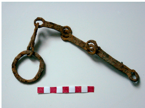
Fig. 1. Catena di tradizione celtica rinvenuta in località Ravorade.

mo volume Castelli del Friuli , il colle di Santo Spirito avrebbe dovuto ospitare sulla sua sommità una piccola fortificazione; 3 a testimonianza di ciò resterebbe uno scasso nel terreno, a forma di fossato, che circonda le pendici accessibili della piccola altura. Di tale scasso, tradizionalmente conosciuto come vallum , resta ancora una traccia visibile, anche se nel secolo scorso venne parzialmente riempito. Circa allo stesso livello del vallum , ma sulle pendici settentrionali del colle, si trova una località dal nome interessante, Cjastilîr : spesso questi toponimi hanno confermato, dopo ri-