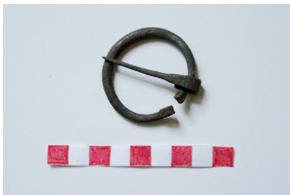
Fig. 5. Fibula ad anello.

La fondazione dell'abbazia di Moggio è sicuro segnale che la strada era nuovamente frequentata e c'era bisogno di una struttura con capacità ricettive e con