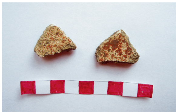
Fig. 2. Due frammenti di cocchiopesto appartenenti ad un edificio di epoca romana.

Fra il materiale dilavato vennero raccolti dei mattoncini pavimentali di opus spicatum e due piccoli