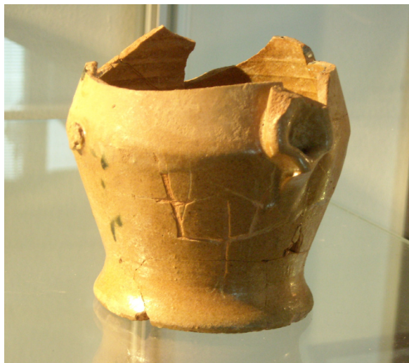
Fig. 6. Fondo di boccale con decorazione a 'denti di lupo'; presenta incise, sulla parete, tre croci.

Per il resto, poco si può dire dell'economia moggese in età abbaziale: il rinvenimento, datato ad alcuni anni fa, di ceramica graffita del XV secolo nel terreno adiacente al luogo dove in passato si trovava il mulino del Motile, apre un debole spiraglio sulle attività produttive amministrare dall'abbazia. 39