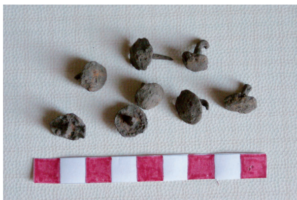
Fig. 4. Chiodini di calzatura di epoca romana.

Materiale archeologico d'epoca romana continua ad affiorare nei dintorni dei due siti indagati: alcuni anni fa, dalla terra presente tra le radici di un albero