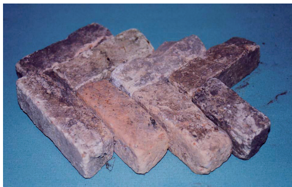
Fig. 3. Mattoncini di pavimentazione appartenenti ad un edificio di epoca romana.

frammenti di cocchiopesto (figg. 2, 3): materiali che sicuramente appartenevano ad un edificio. Il sito è stato oggetto di indagini archeologiche nel 2002; in tale occasione si è proceduto alla ripulitura delle evidenze murarie e alla raccolta di altro materiale.