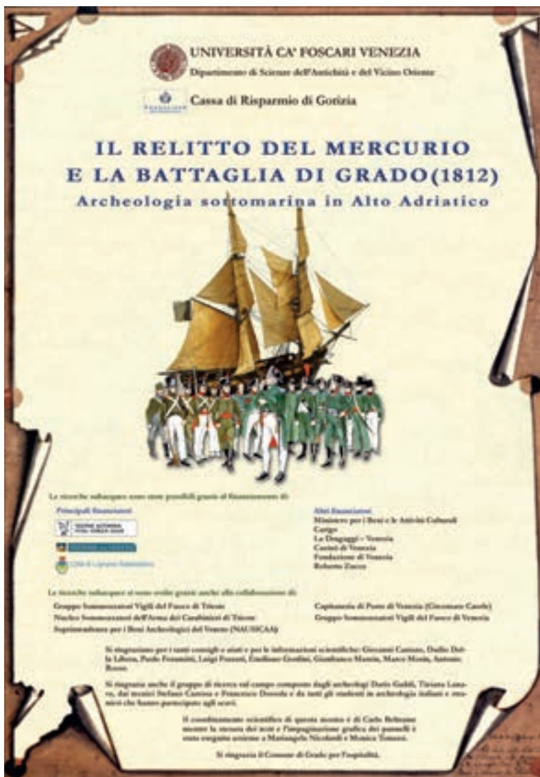
Pannello introduttivo della mostra organizzata a Grado nel 2010.

ha lavorato al GIS e allo studio del materiale della cucina di bordo 5 , Sophia Donadel 6 invece sta completando lo studio degli oggetti personali e delle uni-