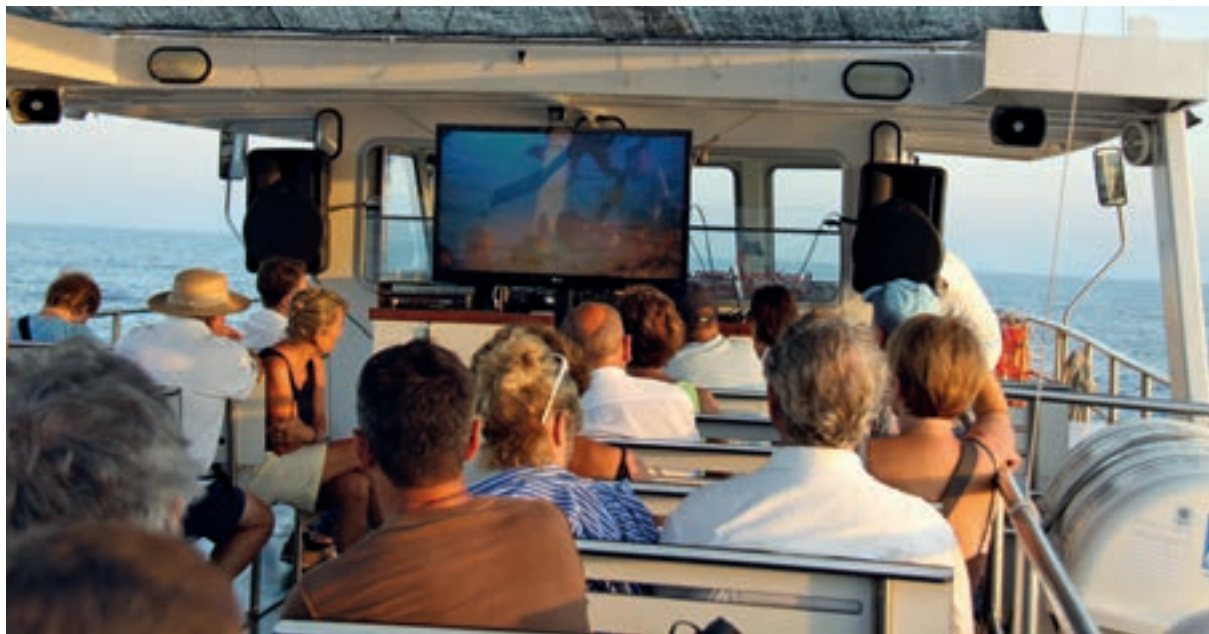
Pubblico a bordo dell'imbarcazione posizionata sopra il relitto del "Mercurio" mentre assiste alle riprese subacquee in diretta commentate dall'autore, nel contesto di "Laguna Movies" di Grado.

Dal punto di vista mediatico, gli scavi sul "Mercurio" hanno avuto immediatamente un grande appeal sui