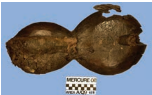
Bozzello a violino semi-integro con stoppo.