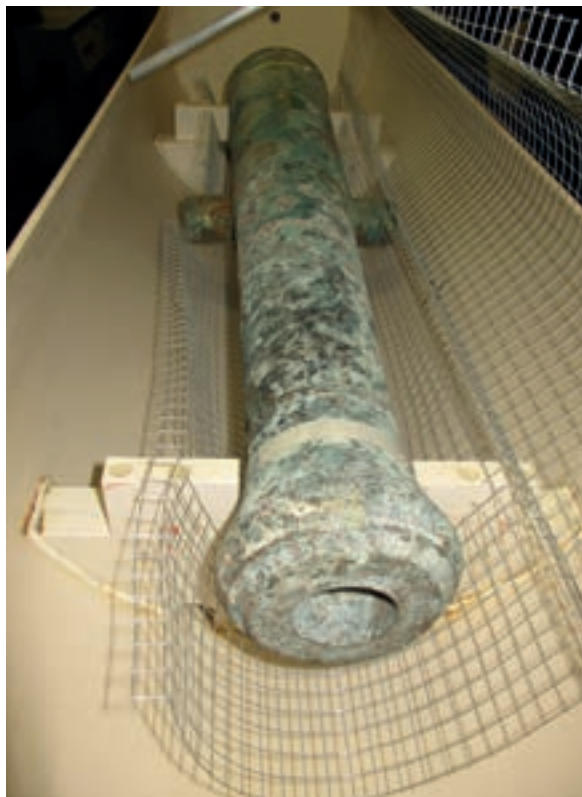
Operazione di restauro per mezzo di elettrolisi della petriera in bronzo, ad opera di G. Moretti nei laboratori dell'Università Ca' Foscari (Foto G. Moretti).

I lavori, finanziati dalla Regione del Veneto sulla base della L.R. 17 del 1986 per l'archeologia, sono stati affidati a laboratori privati e, per parte della