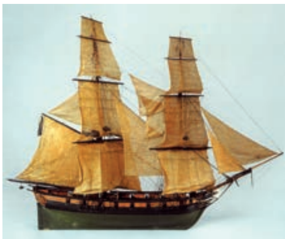
Modello del brick “Le Cygne”, gemello del “Mercurio” (da J. BOUDRIOT, Modèles Historiques. Musée National de la Marine , II, Nizza, A.N.C.R.E, 2006, 110).

Nell'aprile del 2001 il mare di Lignano Sabbiadoro è stato teatro di un ritrovamento di archeologia marittima di grande interesse storico-archeologico. Le reti del peschereccio “Albatros” di Marano della famiglia Scala “pescarono” infatti una carronata in ferro, ossia un pezzo di artiglieria di grosso calibro a canna corta tipico del periodo napoleonico. Le successive indagini, promosse dalla Soprintendenza