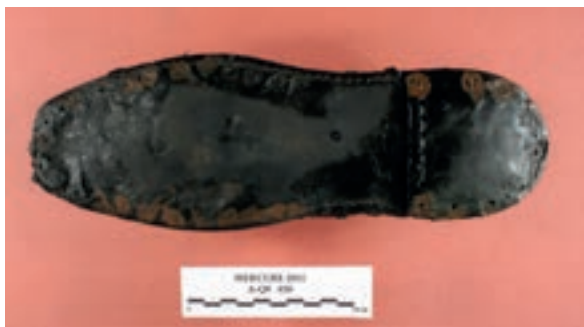
Calzatura di marinaio.