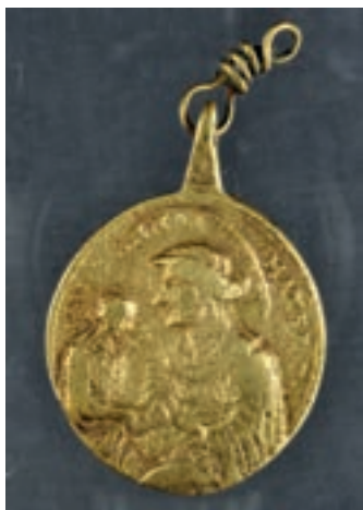
Pendaglio in lega di rame con immagine sacra, dopo il restauro.