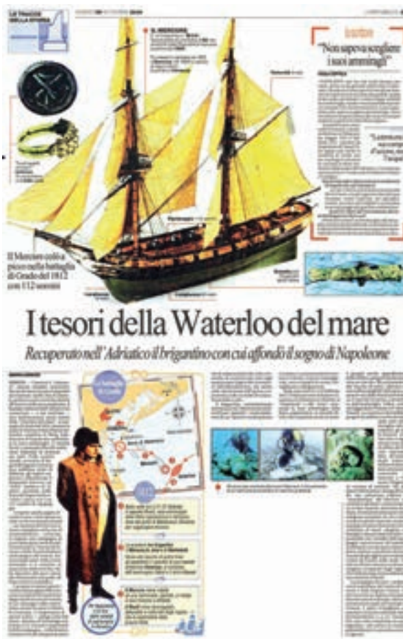
Articolo dal quotidiano «La Repubblica» del 29 settembre 2006.

giornalisti non solo locali. Circa sessanta sono stati gli articoli usciti sulla stampa triveneta («Il Gazzettino», «Il Piccolo», «Il Messaggero Veneto», «La Nuova Venezia», «Il Corriere del Veneto») e molti i servizi sui TG regionali (del Friuli Venezia Giulia e del Veneto) dal 2001 in poi, ma articoli a piena pagina sono usciti anche sui quotidiani nazionali