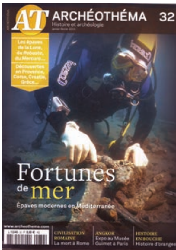
Copertina della rivista francese «Archéothéma» che riporta lo scavo del “Mercurio”.

l'interesse del pubblico è normalmente direttamente proporzionale alla sua “antichità” (e ciò vale anche per qualsiasi altro sito archeologico), in questo caso, malgrado l'evento risalga “solo” al 1812 e si riferisca ad un periodo storico piuttosto ben conosciuto (e quindi teoricamente, ma solo teoricamente, con “poco da aggiungere” a quanto già si sa), è indubbio che la difficoltà di dare un inquadramento storico preciso ad un naufragio di età romana o antica in genere, l'impossibilità di identificare la nave e i suoi