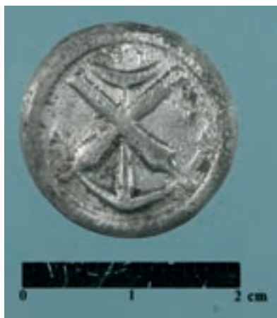
Bottone da giubba di artigliere di marina (Foto E. Costa).