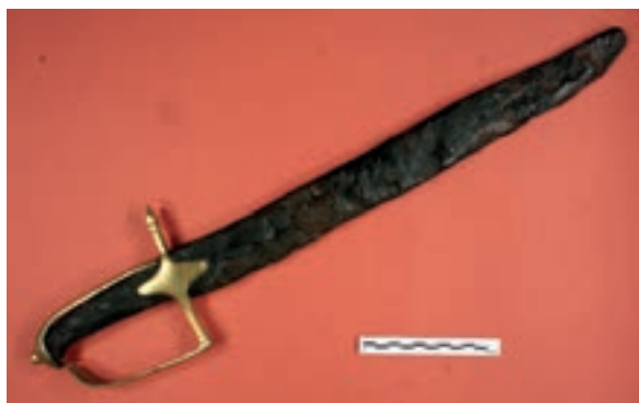
Sciabola dopo il restauro.