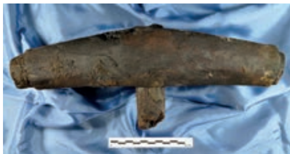
Mazzuolo in legno da cafalato, mutilo del manico.