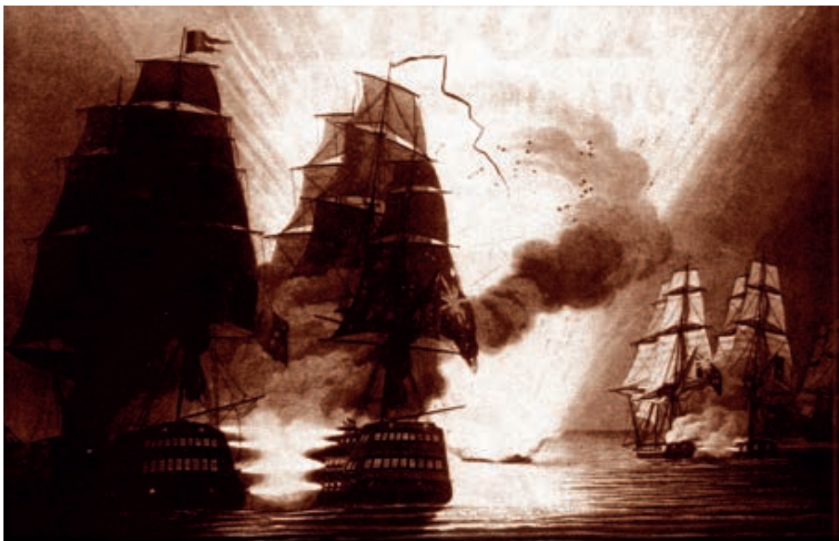
Dipinto raffigurante la battaglia di Grado e l'esplosione del "Mercurio" (National Maritime Museum, Greenwich).

dietro, sottoponendolo ad un fuoco di fila che, dopo pochi minuti, si concluse con la sua esplosione. La battaglia poi proseguì sino all'alba per concludersi con la cattura del "Rivoli", compromettendo quindi i tentativi di recupero del controllo dell'Adriatico da parte del Francese.