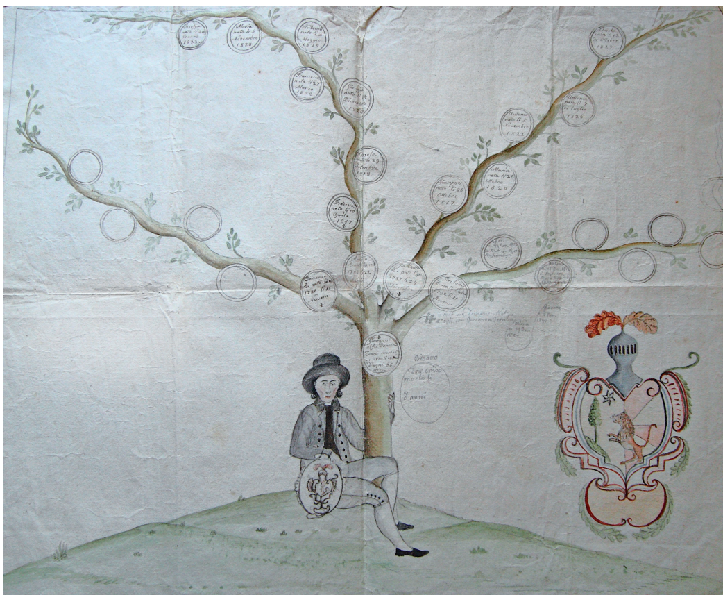
Acquarello raffigurante l'albero genealogico della famiglia Zearo.