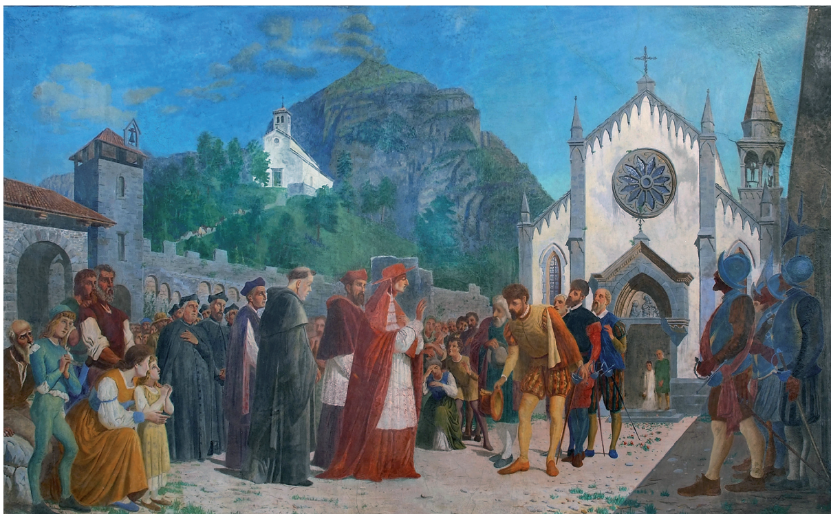
Affresco di Leonardo Rigo (1893) nell'abside dell'Abbazia di S. Gallo abate a Moggio raffigurante la visita di san Carlo Borromeo all'abbazia stessa.

che vide proprio il presule milanese quale attivo e partecipe rappresentante della nascente controriforma.