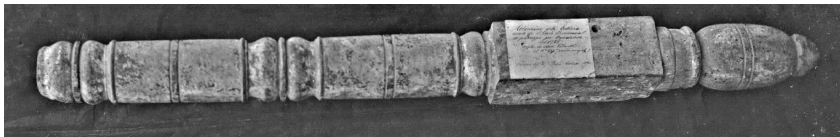
Elemento del letto in cui si narra abbia dormito san Carlo Borromeo.

Carlo Borromeo è un giovane aristocratico, membro di una nobiltà posta di fronte a nuove scelte strate-