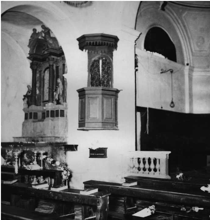
Pulpito ligneo nella chiesa di S. Floriano di Dordolla, la foto risale al 1950.