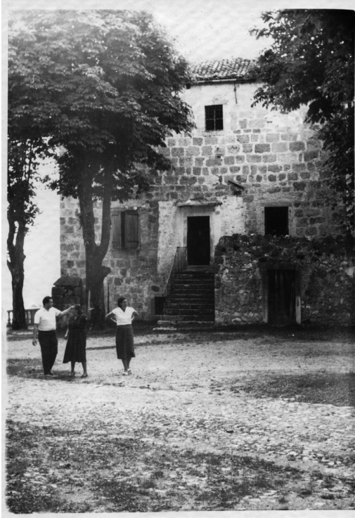
La Torre Medioevale, antico bastione dell'abbazia fortificata risalente al XII sec., detta 'le Prigioni', per l'uso che se ne fece durante il periodo napoleonico.