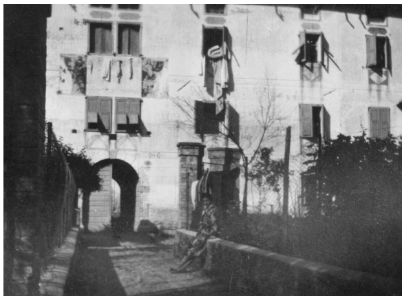
Borgo Linussio, porzione interna.