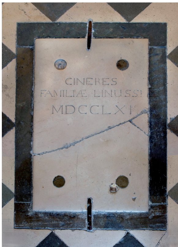
Tomba della famiglia Linussio, abbazia di San Gallo Abate di Moggio.

«[...] Si discorre che vi sia in marcia una quantità di truppa tedesca per questa parte, oltre alli duemila che qui giornalmente vanno passando, e ripassando, e si dubita che non potendovi acquarterarsi tutti in Resiutta, ne possa venire buon numero anche qui in Moggio, ed in questo caso anche le abitazioni di questa fabbrica dovrebbero servire di ricovero militare. Ha pensato dunque di restar qui per non lasciarmi solo, ed ha fatto bene (parla del collaboratore Clama), ma questo per me è un assai debole conforto, giacchè egli è assai