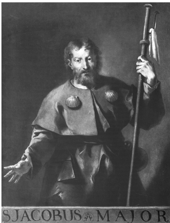
San Giacomo , Duomo di Tolmezzo, tra le lettere del Santo compare il marchio della Fabbrica Linussio.