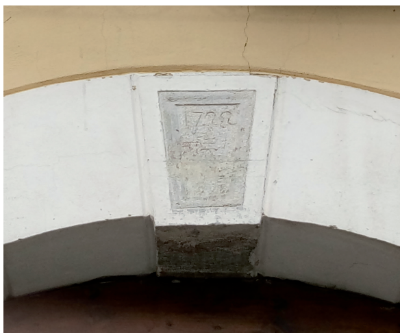
Chiave d'arco datata 1722 ove si legge il marchio della fabbrica, borgo Linussio di Moggio Udinese.