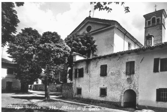
Veduta dell'Abbazia di Moggio.

dine anche per l'amorosa premura con cui il pregiatissimo Pietro si impegna nell'assistere alla rifabbrica della reverenda Casa abbaziale di Moggio che noi abbiamo intrapreso [...]». 9