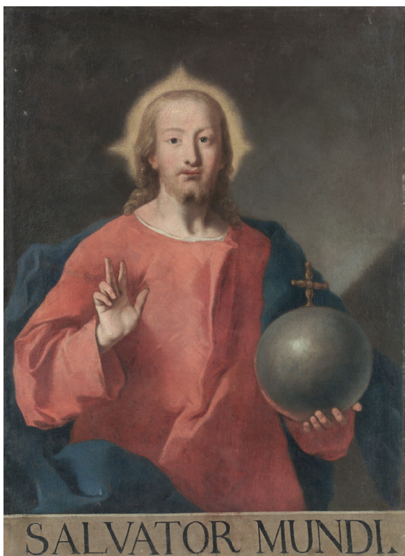
Salvator Mundi , Chiesa della Trasfigurazione di Moggio (Centro Catalogazione Archivio Parrocchiale).

tore nel favorire le comunicazioni commerciali tra Venezia ed il Friuli con il collegamento attraverso un canale tra Palmanova e la laguna di Marano. Il Tron dunque, uomo pubblico e imprenditore privato, non poteva non cogliere come attraverso il Linussio la dimensione artigianale della tradizione potesse divenire ‘nuova industria’. 7