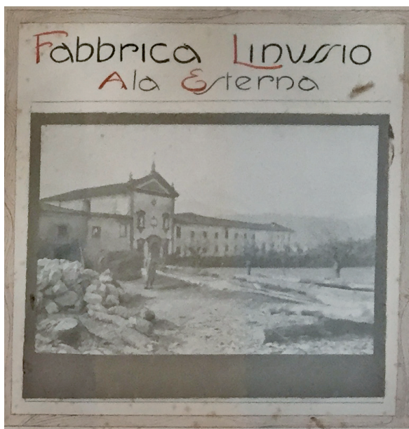
Veduta della Fabbrica Linussio di Tolmezzo.

dine anche per l'amorosa premura con cui il pregiatissimo Pietro si impegna nell'assistere alla rifabbrica della reverenda Casa abbaziale di Moggio che noi abbiamo intrapreso [...]». 9