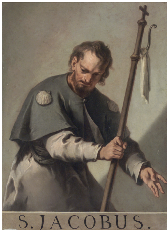
San Giacomo , Chiesa della Trasfigurazione di Moggio (Centro Catalogazione Archivio Parrocchiale).