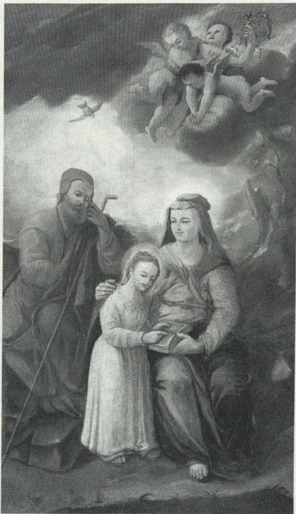
... Gesù, Giuseppe, Maria, ti dono cuore e anima mia... (dipinto nella chiesa di San Michele).

«Durante l'agonia, nella camera, c'era sempre una cicaretta ripiena d'acqua e un fazzoletto, da naso, pulito, con il quale si bagnavano le labbra del moribondo».