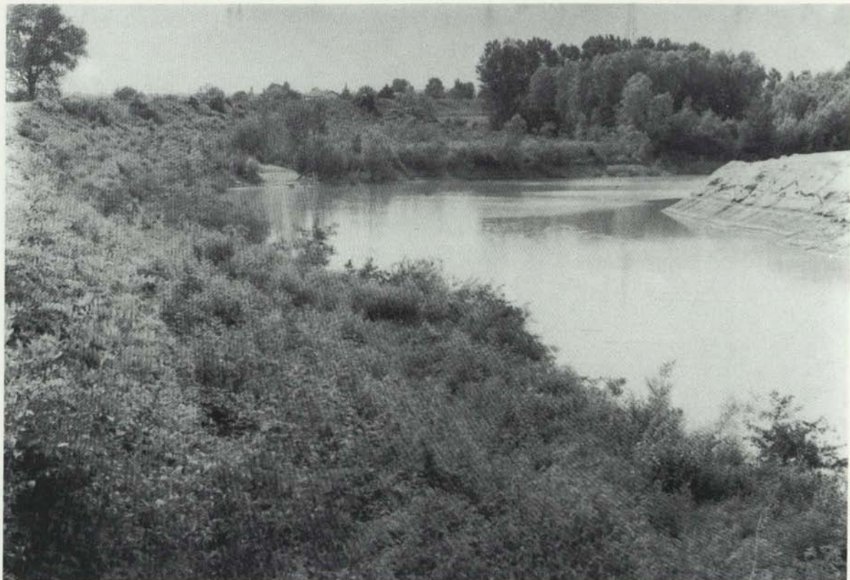
San Giorgio: ...ch'al era il pont pi font dal Timent.

esposto per quella data. A fianco aveva un chierichetto con il turibolo e il sagrestano con il secchiello dell'acqua santa a destra. Faceva la veglia - così si chiamava, - cioè alternava miserere e de profundis. Il tutto durava fin quando i presenti, girando intorno al catafalco, ponevano soldi sul libro delle preci, per il sacerdote, e nel secchiello dell'acqua santa per il sagrestano. Questo non solo il primo e due novembre ma anche nell'ultimo giorno di carnevale: la mattima messa cantata e catafalco, poi come sopra. Non si effettuava solo la processione al cimitero. La sera funzione espiatoria per i peccati commessi durante il carnevale.