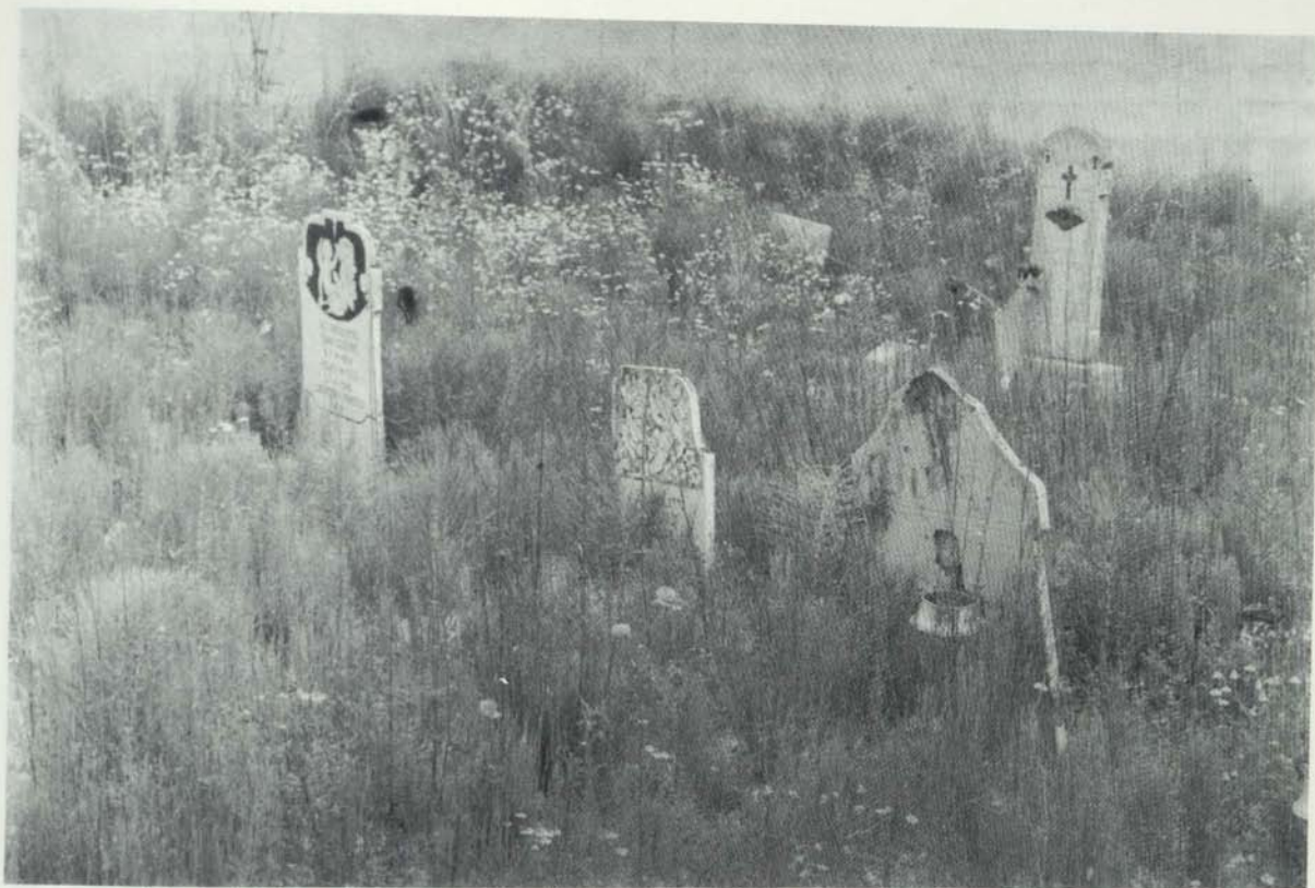
Cesarolo: i bambini non battezzati venivano sotterrati... in un angolino (Limbo) «su un cjanton», il «simitieri pissu».

All'ufficiale, per il disonore, non restò che una strada: il suicidio. Si annegò buttandosi nel Tagliamento.