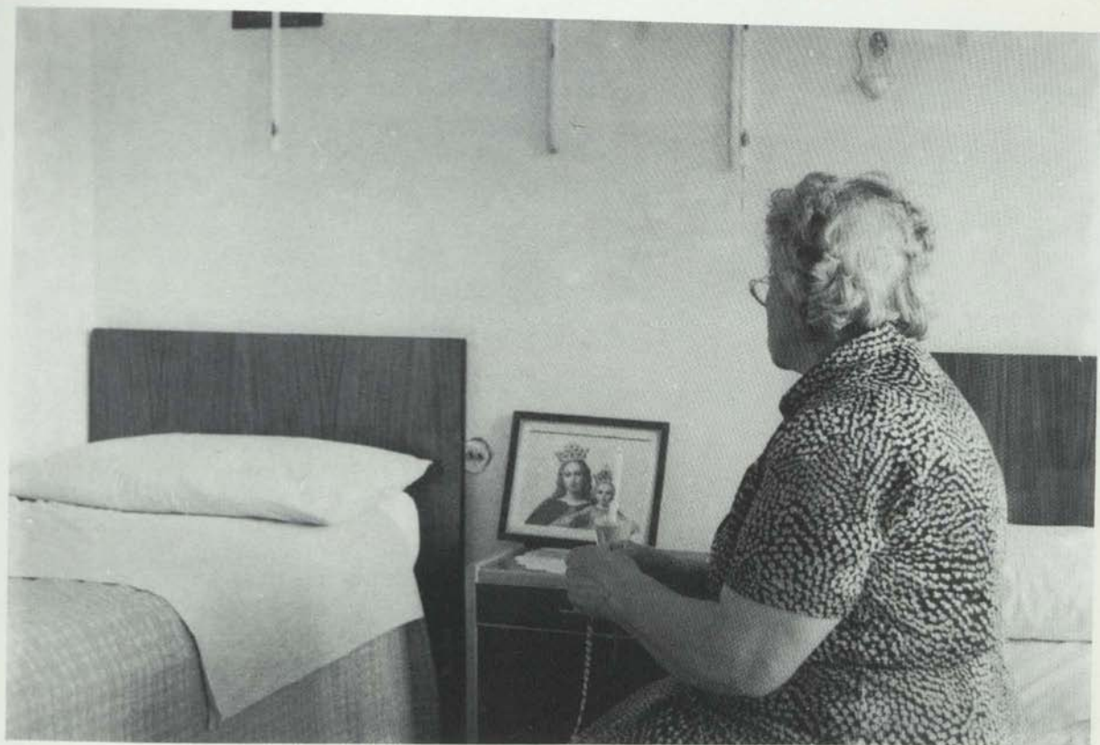
... Alla candela del 2 fevrrar si faceva (e si fa tuttora) ricorso in occasione dei temporalì...

È possibile ascoltare ciò, oggigiorno, da anziani in punto di morte.