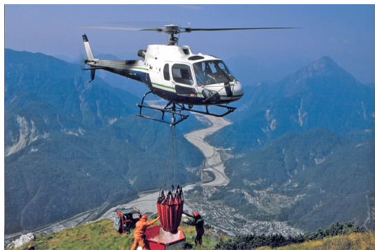
Intervento antincendio sul Monte Pisimoni.

18/11/1978 Fondazione del Corpo volontario dei Vigili del fuoco di Moggio Udinese 08/07/1979 Partecipazione al Triangolare dell'Amicizia dei Tre Confini a Villaco. 08-09/09/1979 Organizzazione della prima festa dei pompieri volontari e gara antincendio. 03/02/1980 Organizzazione del corso di primo soccorso con la C.R.I. di Udine e i medici dell'ospedale di Tolmezzo. 07/05/1980 Termine dei controlli antincendio nei prefabbricati di Moggio. 15/12/1980 Partenza della prima squadra di volontari in soccorso ai terremotati di Vietri di Potenza (seguirono partenze sino al 20/03/1981). 05/06/1980 Ennesimo incendio boschivo a Travasans. Arrestato il piromane.