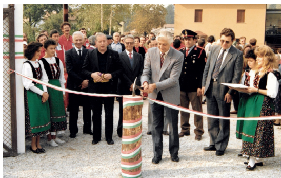
Inaugurazione della sede del Corpo Pompieri Volontari di Moggio, 1989.

Operammo nella fabbrica della Ferrero, ad Alba, per la pulizia dei locali dello stabilimento. Con grande sorpresa scoprimmo un gruppo di studenti del settore elettrico dell'Istituto Tecnico 'Malignani' di Udine i quali, sotto la guida dei loro insegnanti, si prodigavano nello smontaggio dei motori elettrici, li ripulivano accuratamente e poi li rimontavano. I loro interventi riscontrarono un grande apprezzamento da parte della dirigenza aziendale. Dopo quattro giorni di permanenza a Diano D'Alba, ci trasferimmo a Santo Stefano Bello, nel paese natio del famoso poeta Cesare Pavese. Oltre allo svuotamen-