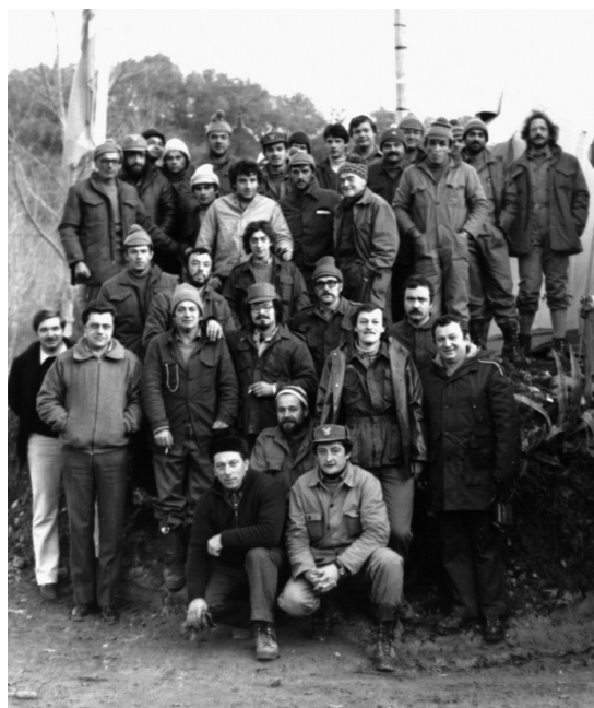
Primo intervento del Corpo Pompieri Volontari di Moggio fuori Regione a Vietri di Potenza nell'anno 1980.