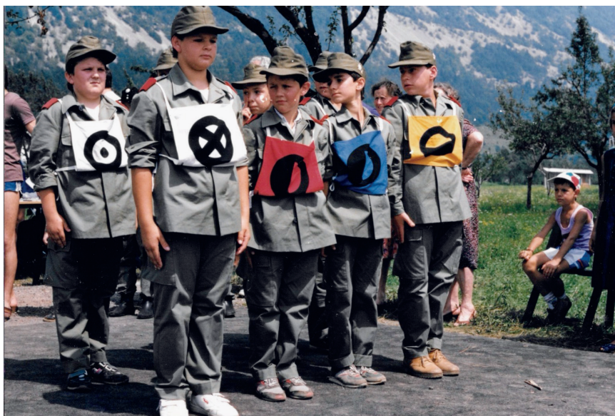
Squadra dei mini pompieri di Moggio durante una dimostrazione antincendio a Zabreznica, 1989.