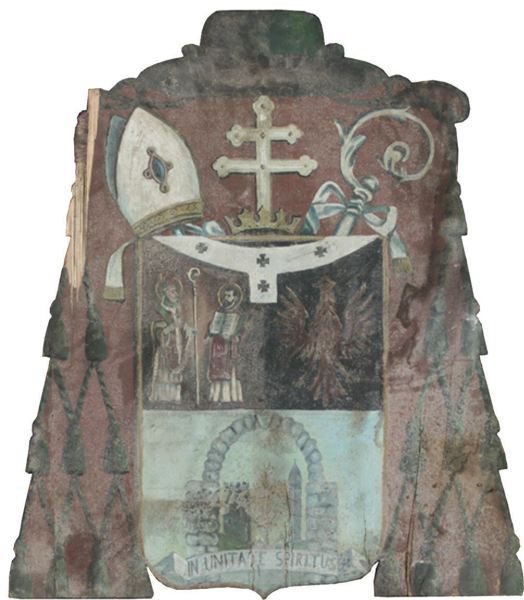
Stemma di mons. Zaffonato.

Per la solennità dei Santi in Abbazia si celebrava la messa 'in terzo', cioè con tre sacerdoti. Nel pomeriggio si pregavano i vesperi, prima i vesperi dei santi e poi quelli dei defunti. Alle sette o otto di sera si recitava il Santo Rosario in chiesa, composto da 150 Avemarie. La chiesa non era riscaldata. Finito il rosario si andava in cimitero per pregare, il sacerdote faceva anche la predica. Successivamente si usciva in processione dalla porta di uscita dal chiostro. Poi suonavano le campane tutta la notte.