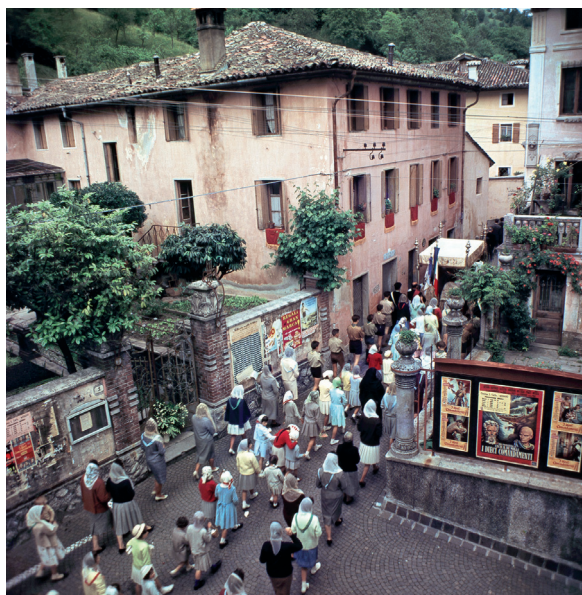
Momenti della processione del Corpus Domini in piazza Uffici e lungo via Traversigne.

Traversigne per poi rientrare in chiesa; si cantava il Tantum ergo e le campane suonavano a festa.