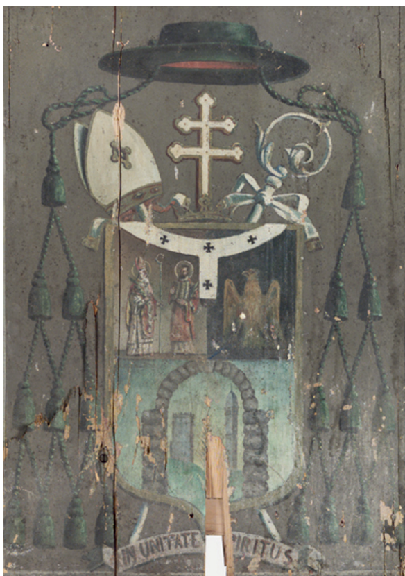
Stemma di mons. Nogara (Centro di Catalogazione regionale-Parrocchia di Moggio Udinese).

accesi. Al termine della celebrazione, il sacrestano preparava il secchiello dell'acqua santa e un cestino davanti al catafalco. I fedeli uscivano dai banchi e in processione vi si recavano davanti per aspergerlo con l'acqua santa e versavano qualche soldo nel cestino. Intanto il sacerdote recitava delle preghiere in suffragio dei defunti e dei canti. Questa usanza era chiamata in friulano 'li' vilis'.